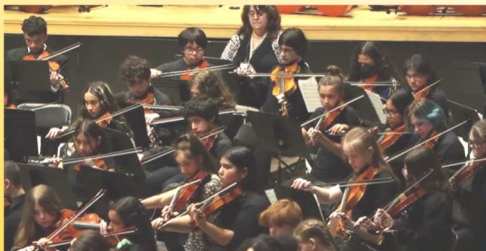
The Belgrade High School Orchestra