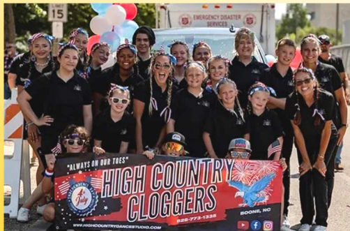
The High Country Cloggers