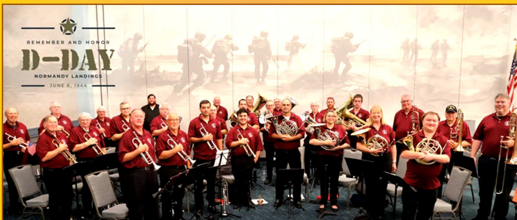
THE FESTIVE BRASS OF MYRTLE BEACH (Floride-USA)